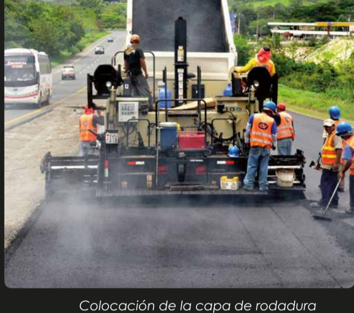
Colocación de la capa de rodadura