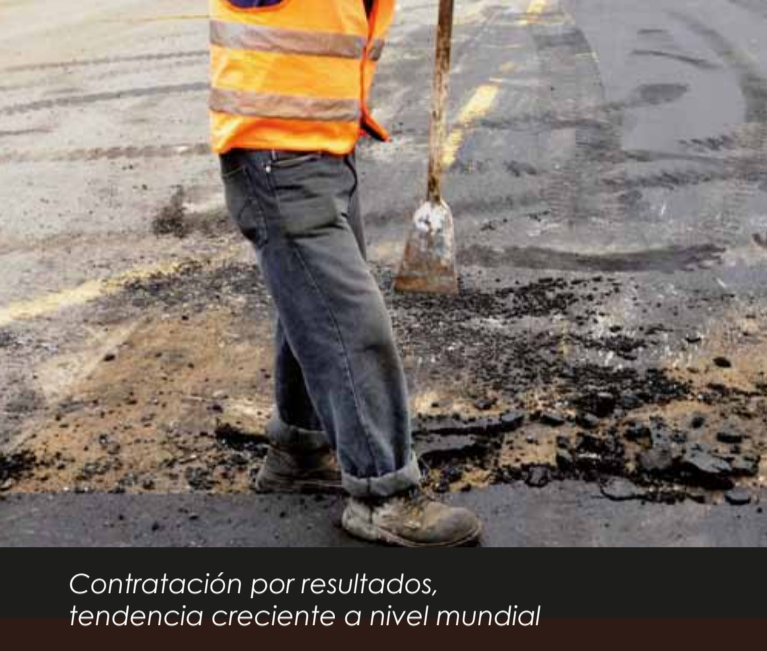
Contratación por resultados. tendencia creciente a nivel mundial