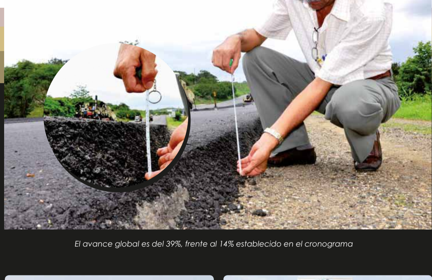
El avance global es del 39%, frente al 14% establecido en el cronograma