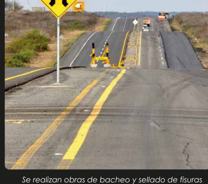
Se realizan obras de bacheo y sellado de fisuras