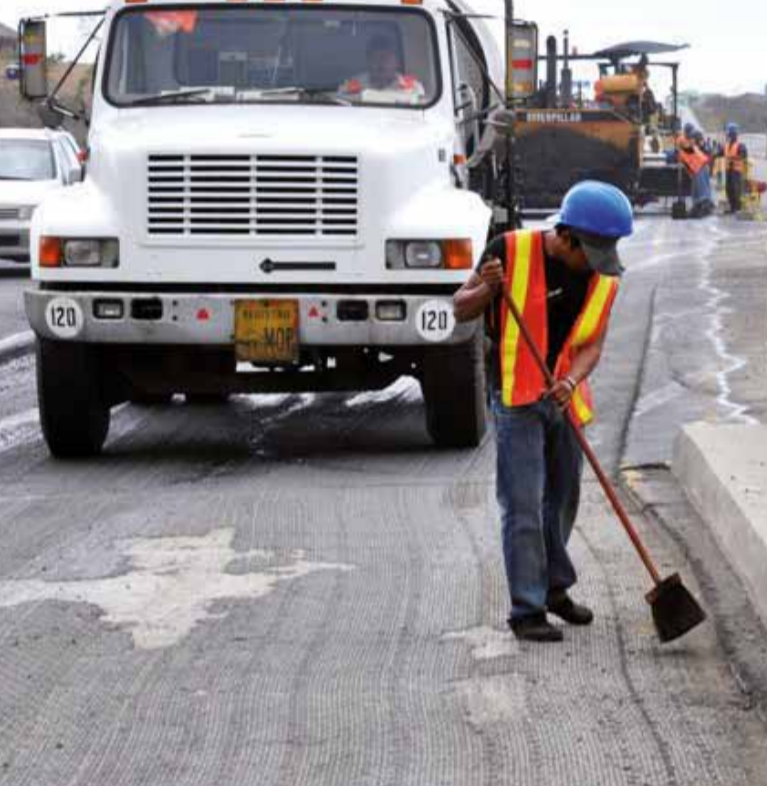
El pago a la constructora, será en función del estado de la vía y el servicio que presta.

El Ministerio de Transporte y Obras Públicas (MTO) ejecuta la rehabilitación y mantenimiento por niveles de servicio o resultados de la carretera Guayaquil - Santa Elena, de 119,20 kilómetros de longitud. La inversión de esta obra asciende a 23'504.566,06 de dólares.