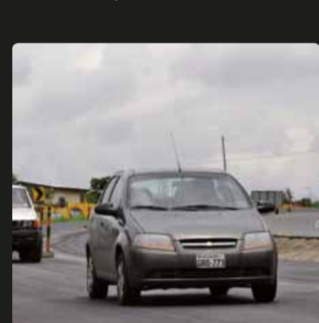
El proyecto mejorará la conectividad desde Guayaquil hacia la provincia de Santa Elena

El contrato vial estatal para la rehabilitación de la carretera Guayaquil - Santa Elena, de cuatro carriles, que es parte de la red vial estatal E-40, se firmó el 19 de octubre de 2010 con la Compañía Verdú S.A. Se prevé que la obra esté concluida el 31 de octubre de 2011. Posteriormente vendrán 36 meses de mantenimiento.