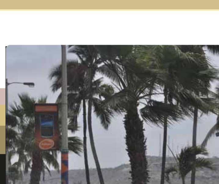
La rehabilitación vial, beneficia a más de 150 mil pobladores de Santa Elena