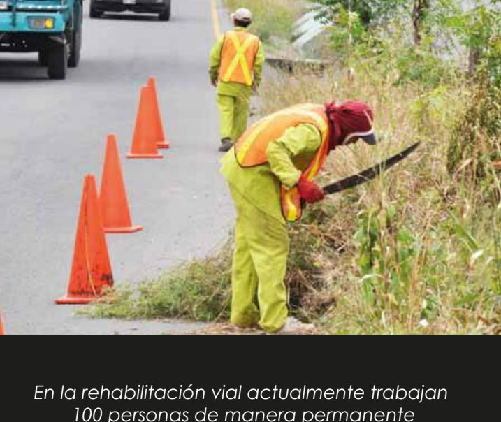
En la rehabilitación vial actualmente trabajan 100 personas de manera permanente

En la rehabilitación vial actualmente trabajan 100 personas de manera permanente. Además, el MTO establece de forma obligatoria para la constructora, la integración de contratistas con microempresas, que son integradas por comuneros de las zonas, para que realicen roza a mano, corte y retiro de arbusto, y la limpieza de alcantarillas, pequeños derrumbes, de la calzada y espaldones, etc.