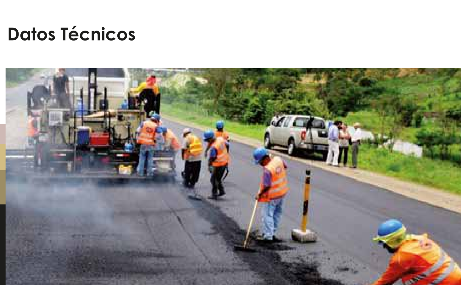
El proyecto está dividido en dos tramos: Guayaquil - Chongón y Chongón - Santa Elena - Chongón

Esta autopista, cuyos primeros 67 kilómetros corresponden a Guayas, y 52,20 km a Santa Elena, se ha dividido en dos tramos para su rehabilitación. El primero corresponde a Guayaquil - Chongón (115,2 km), cuyo estado de deterioro requiere una intervención mayor, por lo que los trabajos están encaminados a lo siguiente: