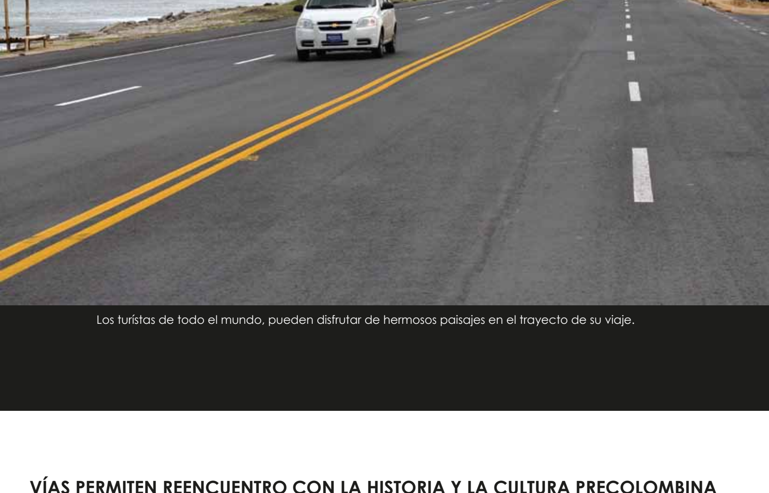
El avance físico en el tramo Santa Elena - Bahía de Caráquez es del 71%

Asimismo el turismo será uno de los renglones beneficiados, al vincular la Ruta del Spondylus, sin ningún retraso e interrupción, desde Santa Elena hasta Esmeraldas. En esta obra tan ansiada por los manabitas se invirtió alrededor de 102 millones de dólares.