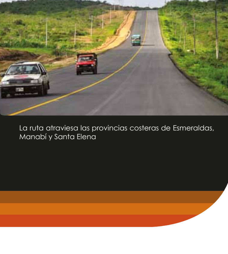
El proyecto regional contempla 790 km de longitud.

EN LA RUTA DEL SPONDYLUS PROYECTO QUE IMPULSA EL TURISMO SOSTENIBLE Y LA PRODUCTIVIDAD ECUATORIANA