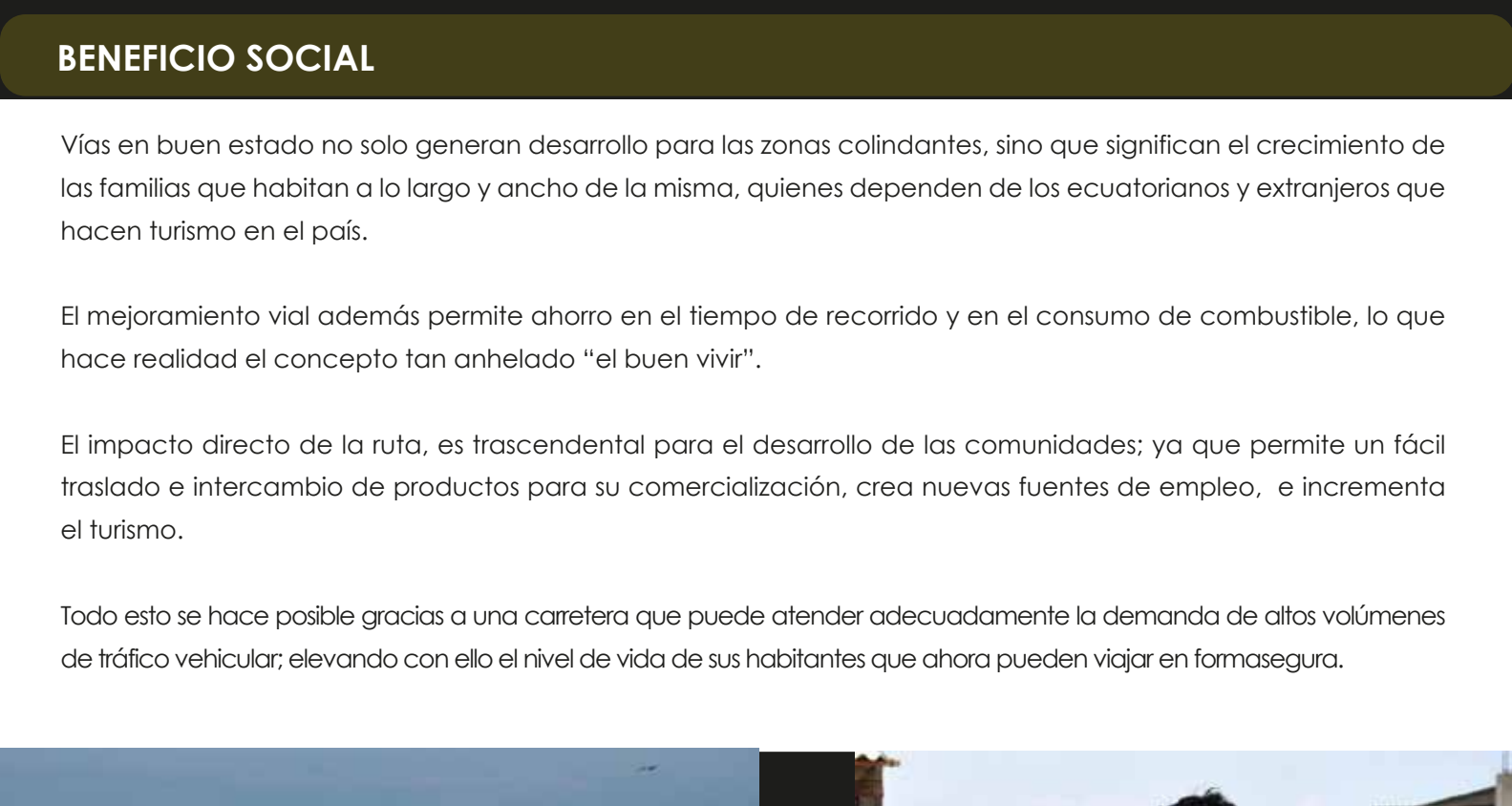
Los turistas de todo el mundo, pueden disfrutar de hermosos paisajes en el trayecto de su viaje.

Varias localidades como Ballenita, Olón, San José, Salango, Puerto López, Jaramijó, Rocafuerte, San Andrés, Charpotó, Santa Elena, San Clemente, Bahía de Caráquez, entre otras; se enlaza la principal vía de primer orden, que cuenta con una adecuada señalización que brinda seguridad y confort. Próximamente, en algunos tramos se implementarán las ciclovías.