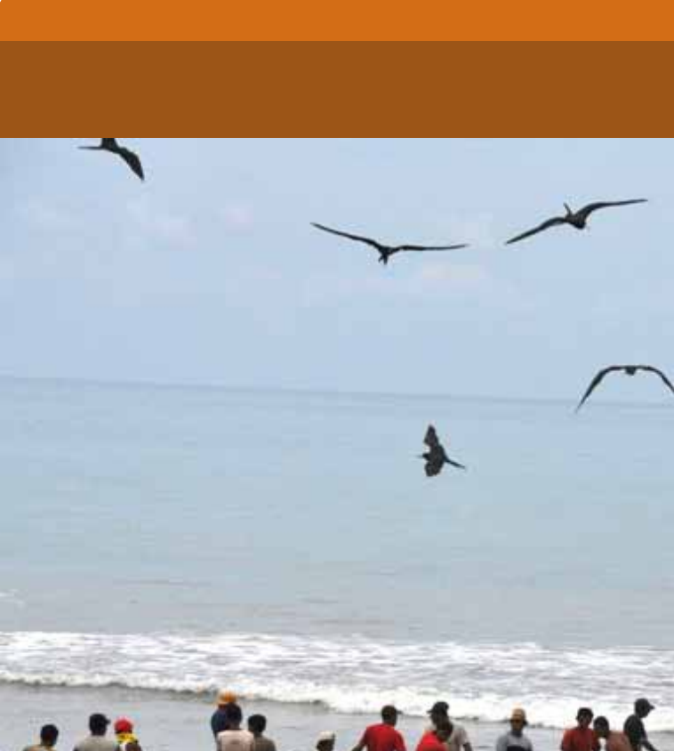
La ruta atraviesa las provincias costeras de Esmeraldas, Manabí y Santa Elena.

Para incorporar a las comunidades dedicadas a la pesca, artesanías y atender a turistas nacionales y extranjeros, el Gobierno Nacional, construye la Ruta del Spondylus. Obra que atraviesa las provincias costeras de Esmeraldas, Manabí y Santa Elena, y que se perfila como un elemento fundamental de la red vial nacional que cambiará radicalmente no solo la forma de circular y transportarse en la costa ecuatoriana, sino que impulsará el desarrollo integral del país.