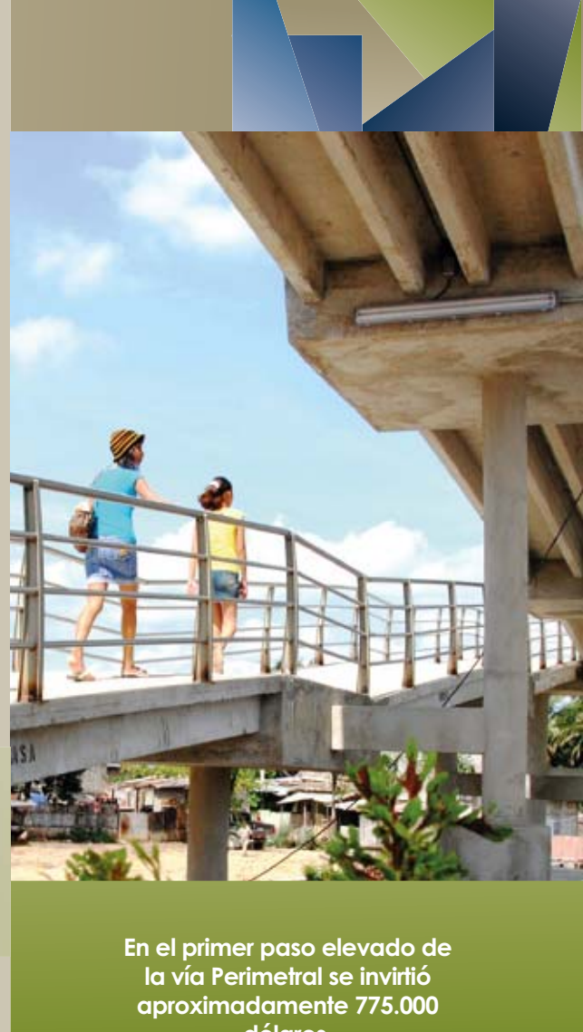
En el primer paso elevado de la vía Perimetral se invirtió aproximadamente 775.000 dólares.

El pasado 05 de septiembre de 2010, 17 personas murieron en la vía Perimetral de Guayaquil producto de un atropellamiento masivo.