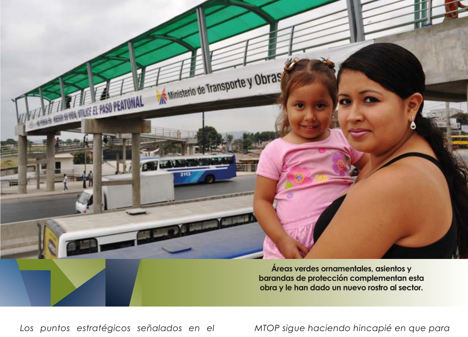
Áreas verdes ornamentales, asientos y banderas de protección complementan esta obra y le han dado un nuevo rostro al sector.

Los puntos estratégicos señalados en el informe de la CTE donde se construirán los ocho pasos elevados son: la Universidad del Pacífico, Ceibos Norte, Eucalipto, Cooperativa Gallegos Lara, Hospital Universitario y dos que se ubicarán a la altura de la Isla Trinitaria. A propósito de estos dos últimos, ya se encuentran en la fase final de los estudios para su construcción.