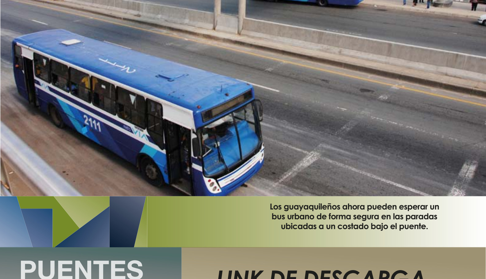
Los guayaqueños ahora pueden esperar un bus urbano de forma segura en las paradas ubicadas a un costado bajo el puente.