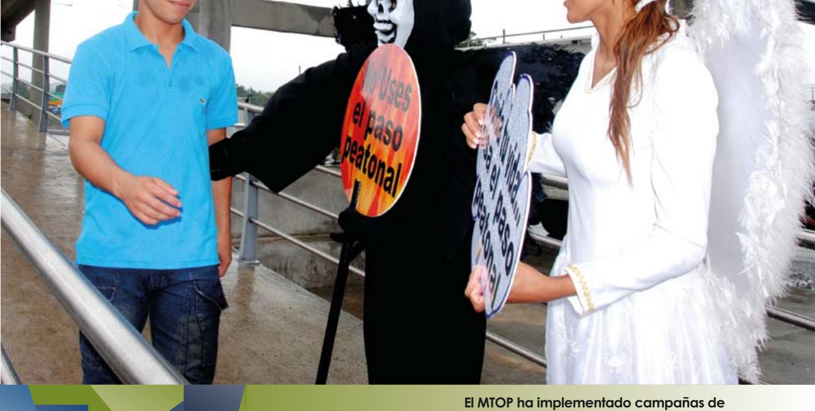
El MTOP ha implementado campañas de concienciación sobre el respeto a la Ley de tránsito dirigidas a la comunidad.