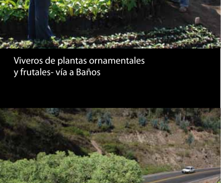
Viveros de plantas ornamentales y frutales- vía a Baños

Este proyecto, sin duda, inyectará un fuerte impulso a las zonas turísticas por donde atraviesa esta carretera estatal, como es el caso concreto de la comunidad de "Los Salasakas", población que tiene alrededor de 6.000 y 8.000 habitantes.