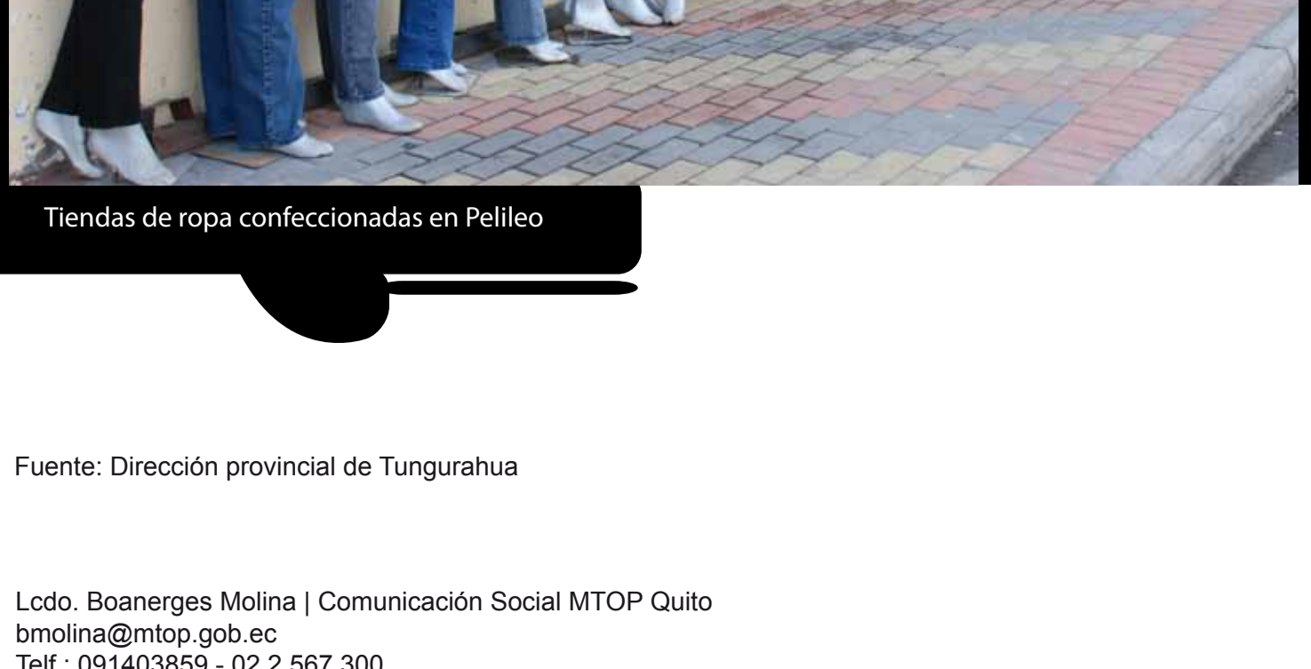
Tiendas de ropa confeccionadas en Pelileo