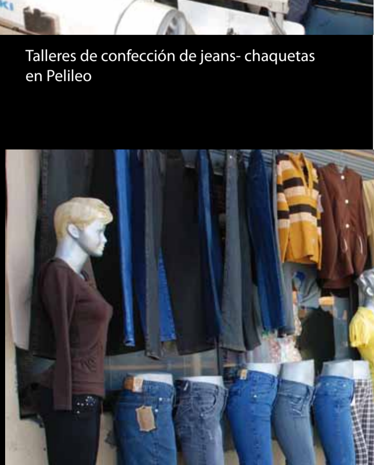
Talleres de confección de jeans- chaquetas en Pelileo