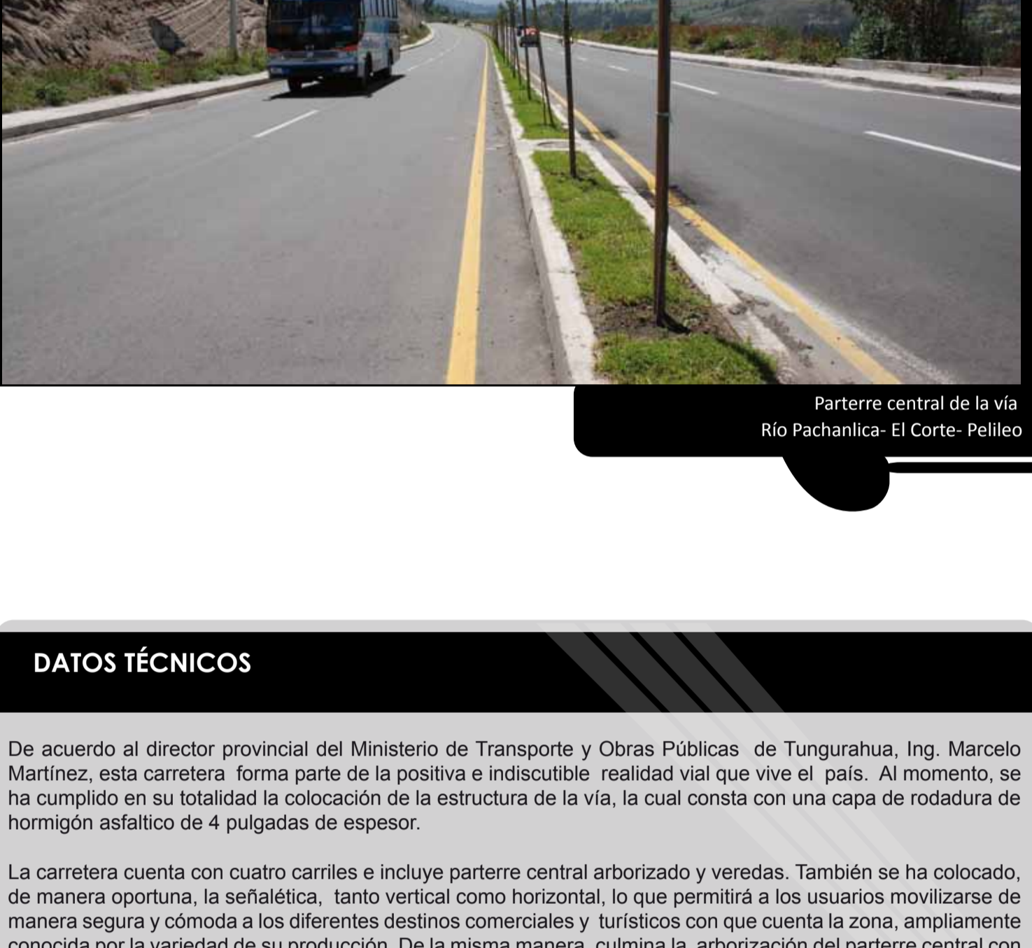
Parterre central de la vía Río Pachanlica- El Corte- Pelileo