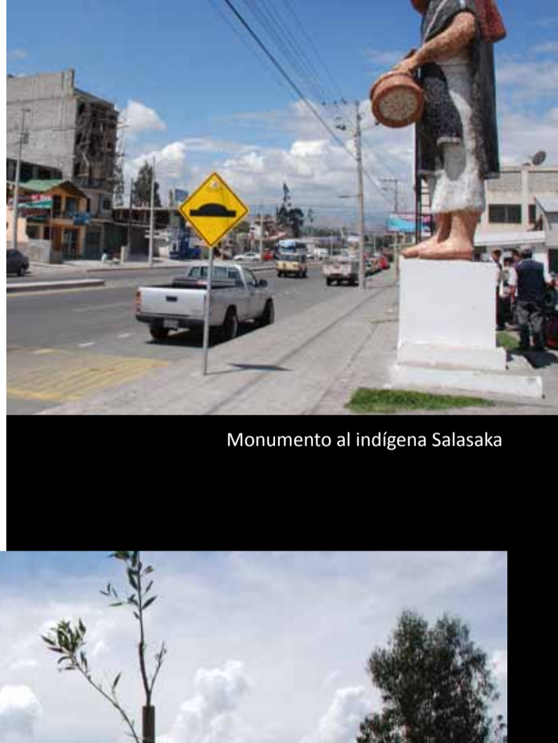
Monumento al indígena Salasaka

Esta construcción de mando la participación de personal para dotación de mano de obra, que en su producción más alta fue de unas 120 personas, de manera directa entre técnicos, soldadores, maquinistas y de manera indirecta esta edificación contó con al menos 280 personas, entre comerciantes, transportistas, preparación de alimentos, entre otros.