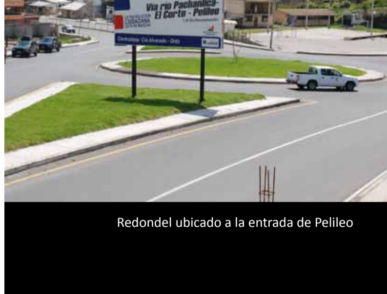
Redondel ubicado a la entrada de Pelileo

El Ministerio de Transporte y Obras Públicas realiza en la provincia de Tungurahua, la ampliación y reconstrucción de la carretera Totoras - Río Pachanlica - El Corte - Pelileo, de 7.1 Km de longitud, por un monto de USD. 57.098.624,75 dólares.