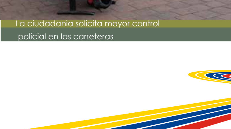
La ciudadanía solicita mayor control policial en las carreteras