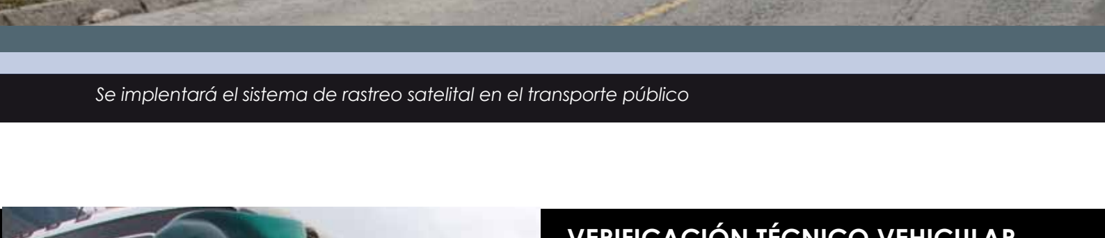
Se implementará el sistema de rastreo satelital en el transporte público

El Ministerio de Transporte y Obras Públicas y de la Comisión Nacional de Transporte Terrestre, Tránsito y Seguridad Vial, a través de la Subsecretaría de Transporte Terrestre y Ferroviario determinó políticas que permitirán el mejor funcionamiento del transporte, implementando mayores controles a los conductores y verificando el estado de los vehículos, a fin de brindar un servicio de calidad.