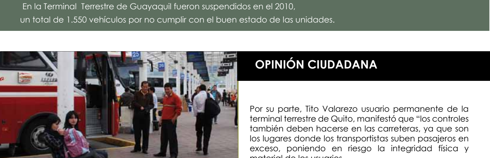
En la Terminal Terrestre de Guayaquil fueron suspendidos en el 2010, un total de 1.550 vehículos por no cumplir con el buen estado de las unidades.

Los controles se realizan en las terminales terrestres de pasajeros de las cabeceras cantonales como Guayaquil, Playas y Milagro, así como en las distintas carreteras de la provincia. En la Terminal Terrestre de Guayaquil fueron suspendidos en el 2010, un total de 1.550 vehículos por no cumplir con el buen estado de las unidades.