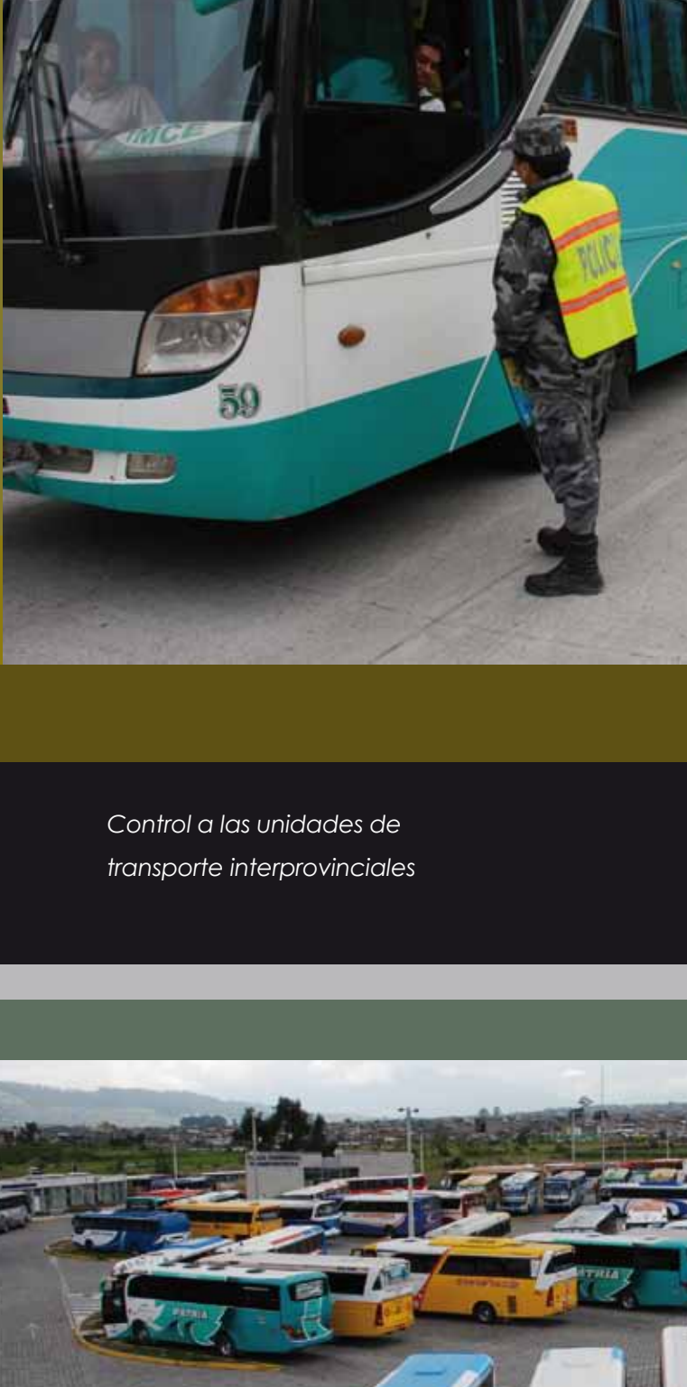
Control a las unidades de transporte interprovinciales