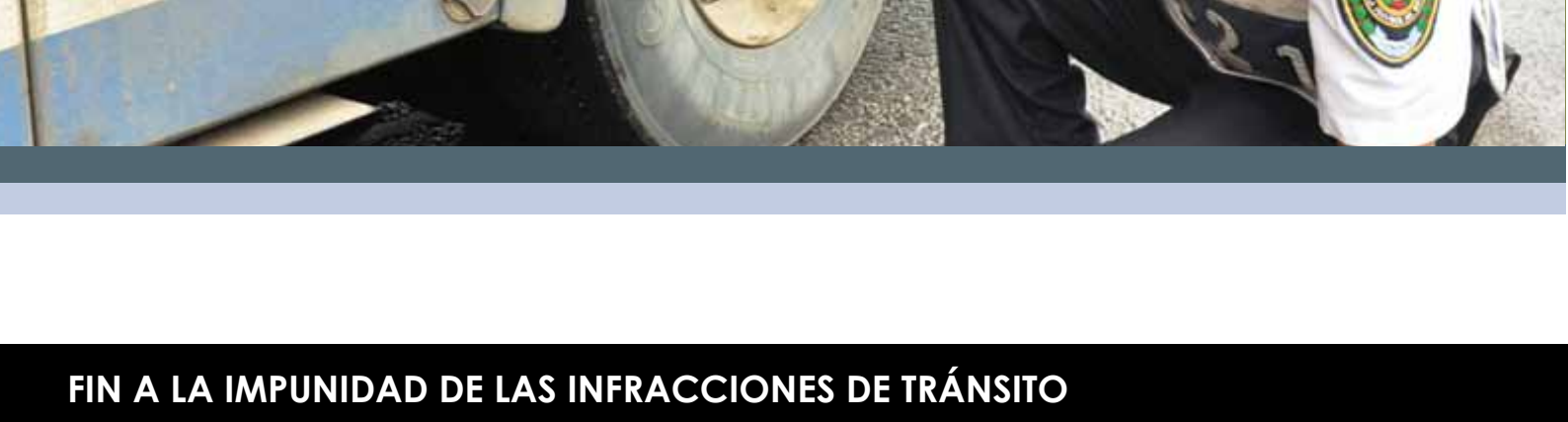
Implementación del sistema de vulcanización que permite la marcación de la placa en la llanta

Este proceso será llevado a cabo por el Ministerio de Transporte y la Agencia Nacional de Tránsito, sin que represente costo alguno para el propietario de la unidad. Adicionalmente se tiene previsto instalar agencias de revisión vehicular en cada una de las 7 regiones del país, en los primeros meses del año.