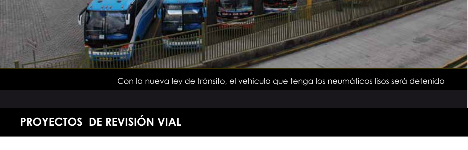
Con la nueva ley de tránsito, el vehículo que tenga los neumáticos lisos será detenido

A causa de los accidentes ocasionados a finales del 2010 por las unidades de las Cooperativas Turismo Oriental y Reina del Camino, el Gobierno Nacional, decidió tomar medidas drásticas, a fin de que los transportistas cumplan los controles, y se evite más accidentes de tránsito.