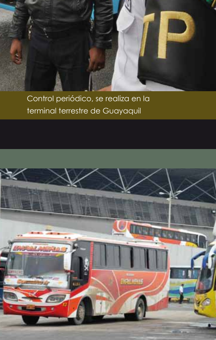
Control periódico, se realiza en la terminal terrestre de Guayaquil