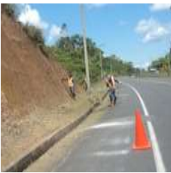
Tramo: Puyo – Capricho