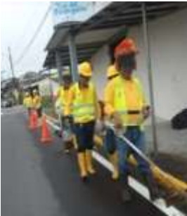
Ruta: E30 Tramo: Puyo – Abitagua