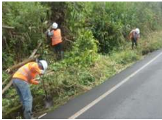
Ruta: E45 Tramo: Puyo – Puente Río Pastaza