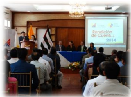
Mesa directiva (izquierda - Derecha)