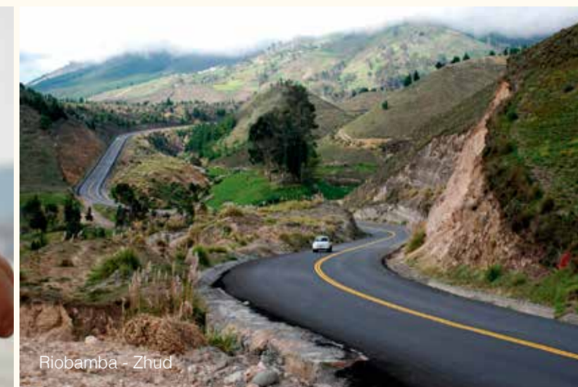
Riobamba - Zhud