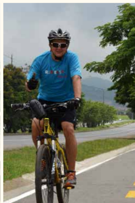
Colimes - Olmedo