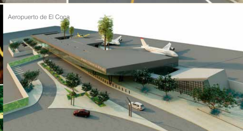
Aeropuerto de El Coca