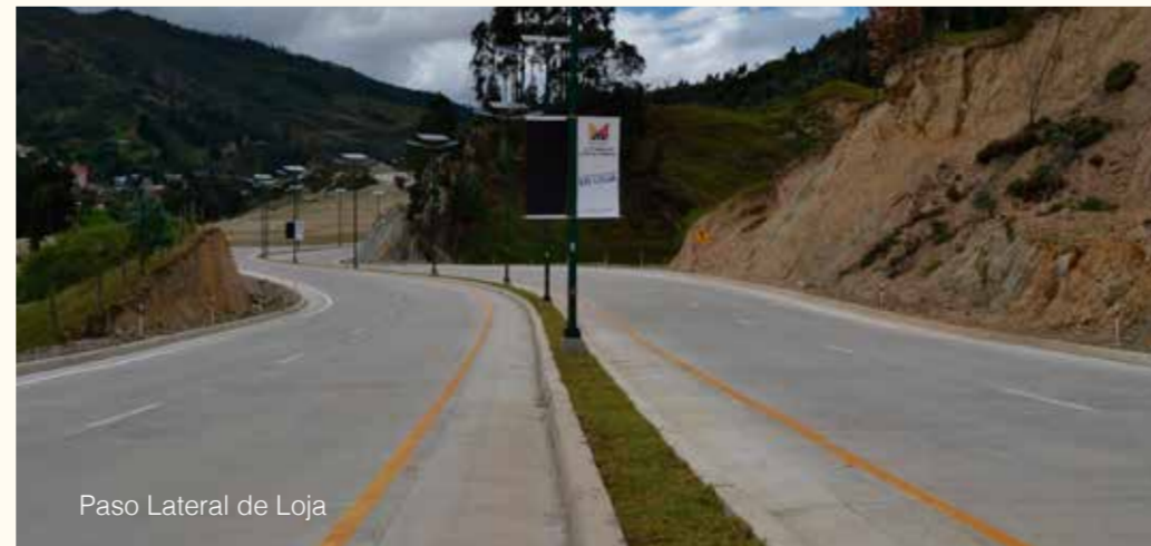
Paso Lateral de Loja