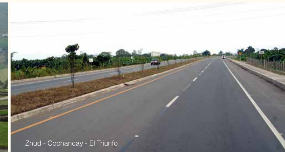
Zhud - Cochancay - El Triunfo