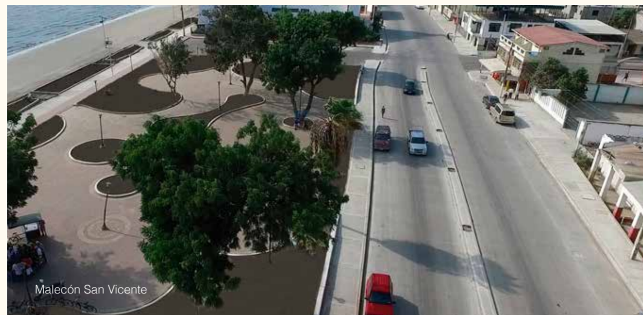
Malecón San Vicente

Espíndola conocido como la "Orquídea del Sur" por la variedad de orquídeas que florecen en la zona, está ubicado al sureste de la ciudad de Loja y es el límite con el vecino país del Perú, lo que la convierte en la puerta de entrada para el intercambio comercial entre ambos países.