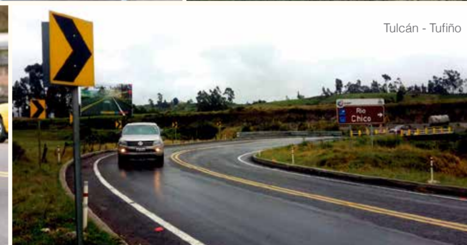
Tulcán - Tufiño