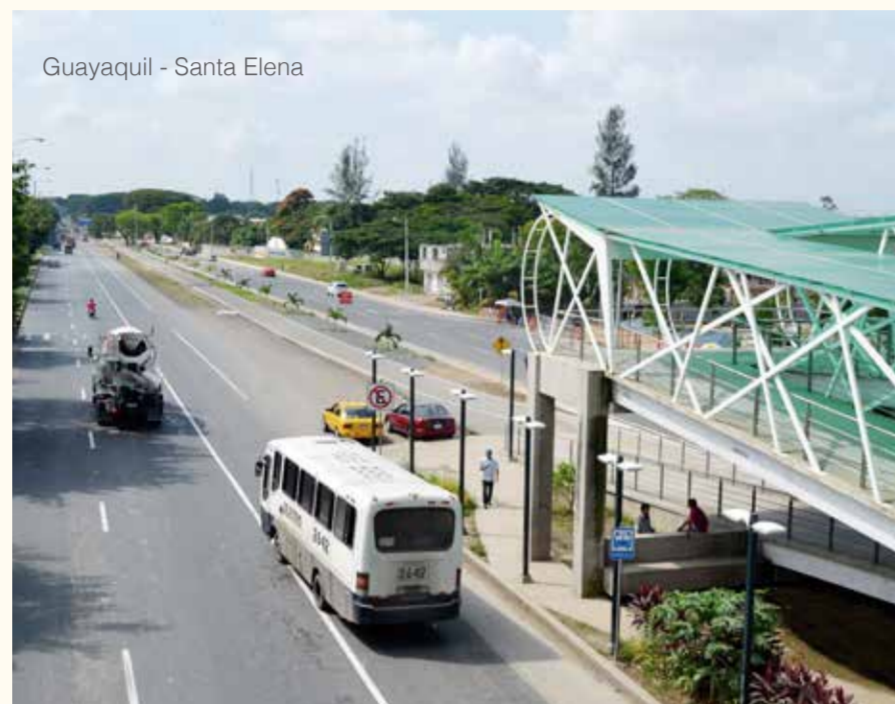
Guayaquil - Santa Elena

En el año 2015 el Gobierno de la Revolución Ciudadana a través del Ministerio de Transporte y Obras Públicas ha invertido $ 725'179,759,89 en vías, puertos, aeropuertos y sistema de transporte. Ecuador ya cambió y la revolución vial se disfruta en cada rincón de la patria.