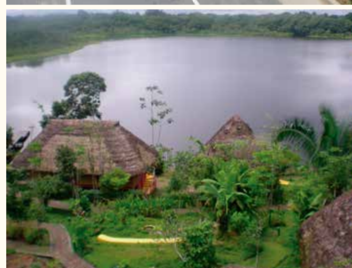
Otavalo - Cajas