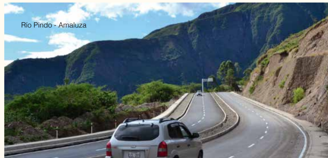
Río Pindo - Amaluza