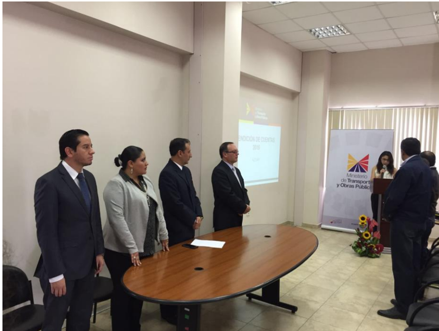
Funcionarios y directores asistieron al evento del MTOP de Azuay