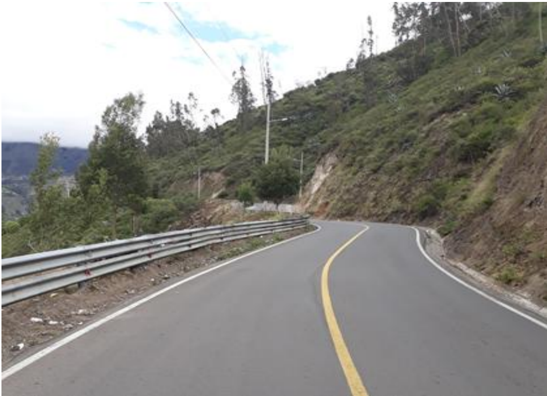
Foto 10 – Km 11+000 se mantiene sección transversal. Vista hacia Patate.