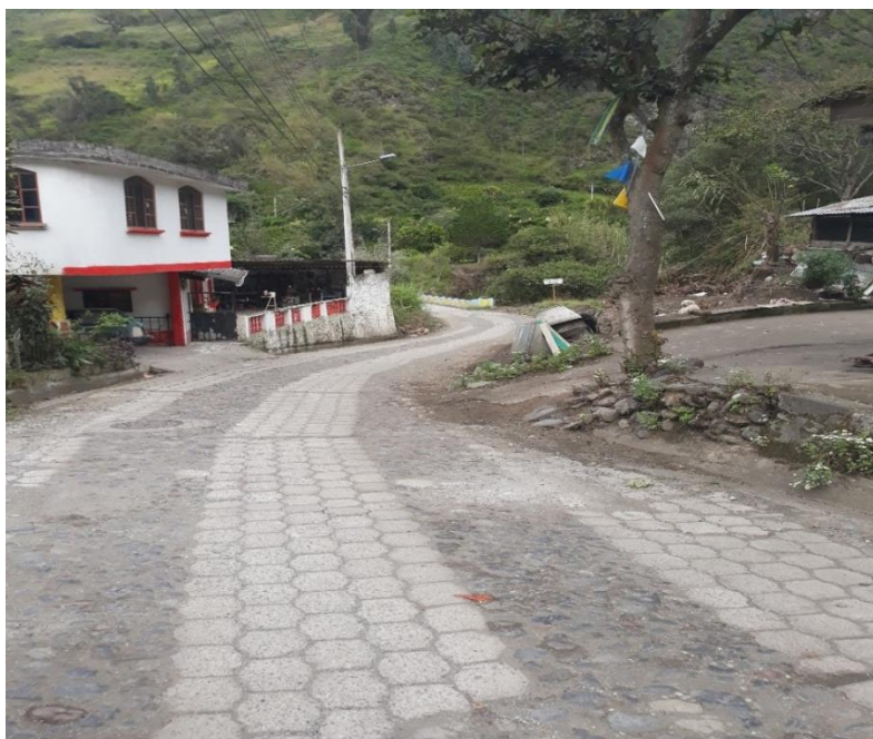
Foto 34 – Km 26+800 capa de rodadura de adoquín. Vista hacia Patate.