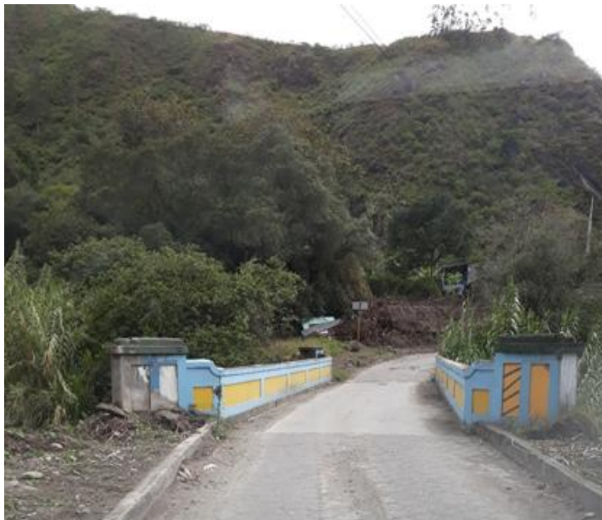
Foto 33 – Km 26+500 capa de rodadura de adoquín y puente angosto de 20 m.