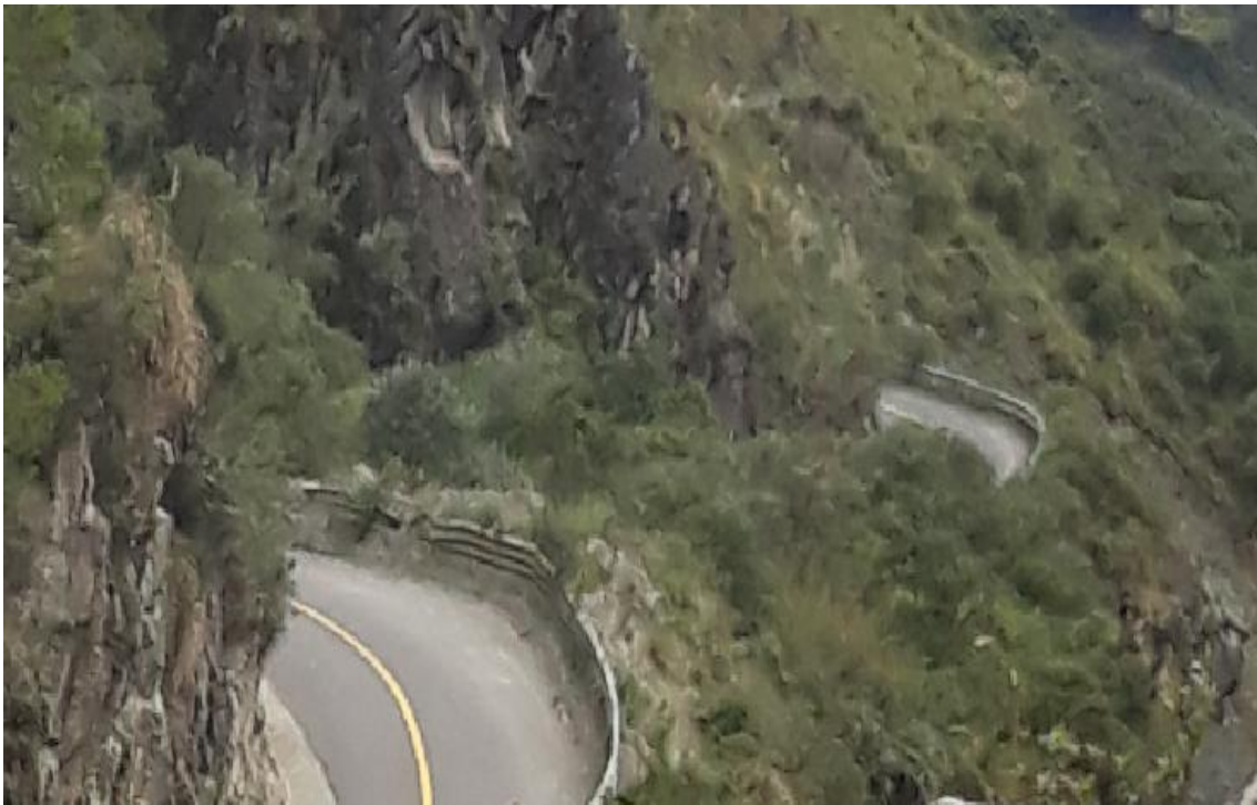
Foto 29 – Km 22+500 al km 24+600 zona crítica. Gradientes transversales fuertes.