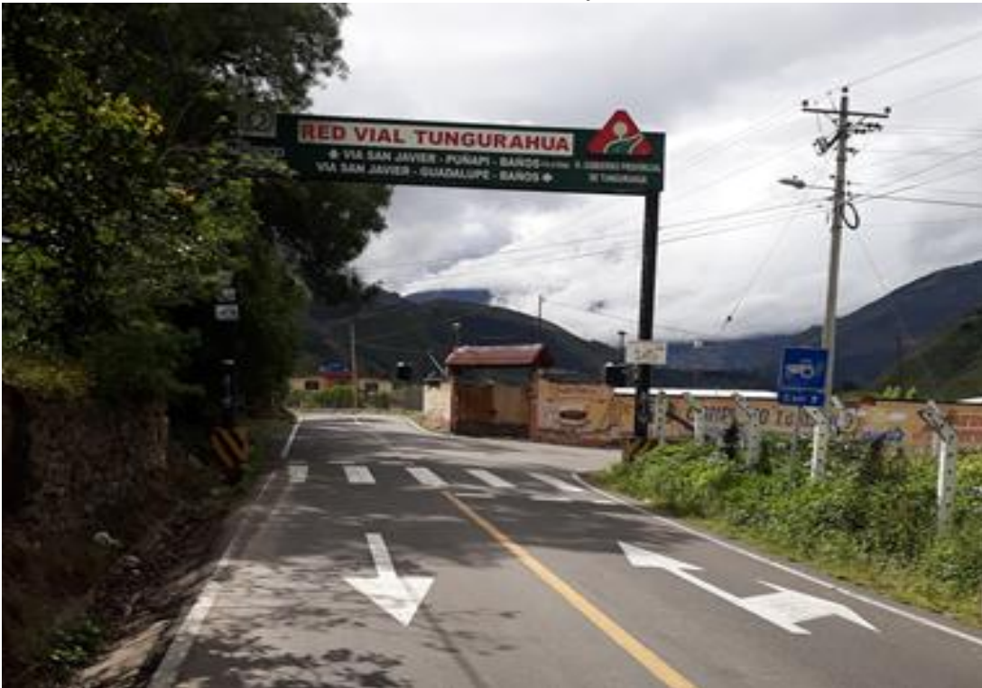
Foto 14 – Km 14+100 camino de salida hacia Guadalupe en vía Pelileo – Baños.