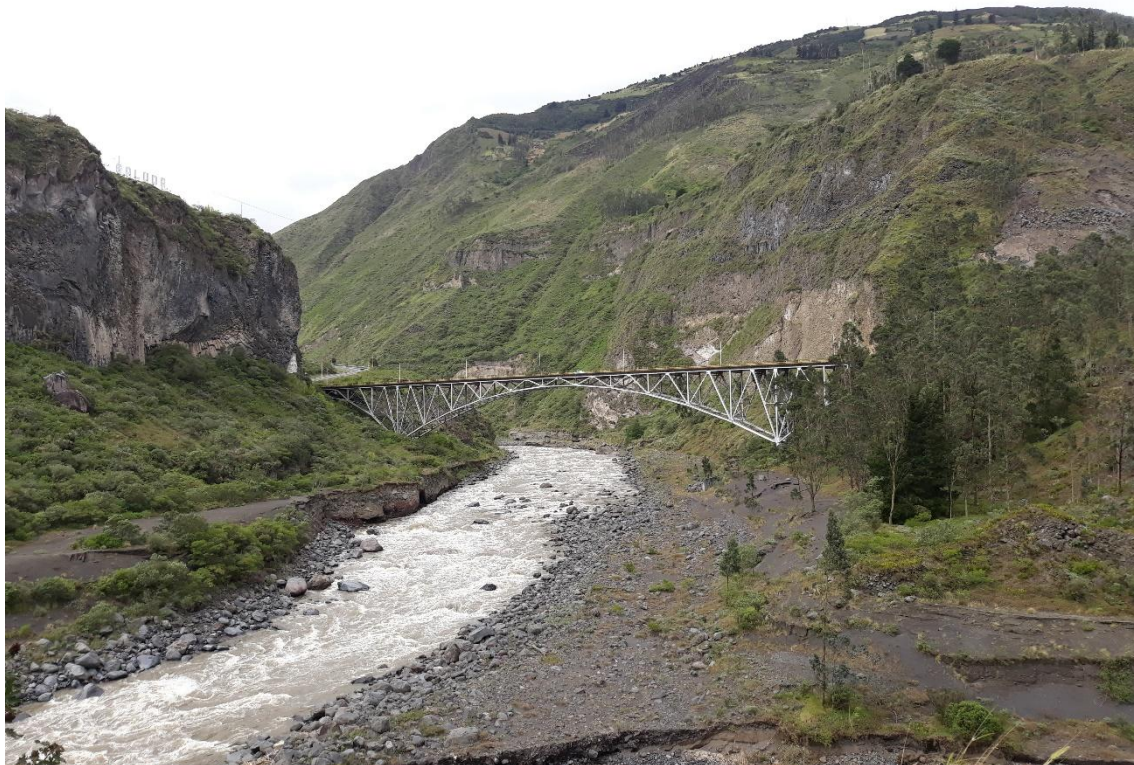
Foto 31 – Km 22+900 vista de puente Las Juntas, al frente de la vía Patate – Baños.