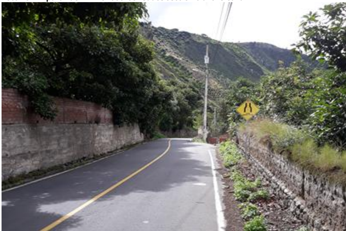
Foto 15 – A partir del km 15+600 se reduce sección transversal a 4 m.