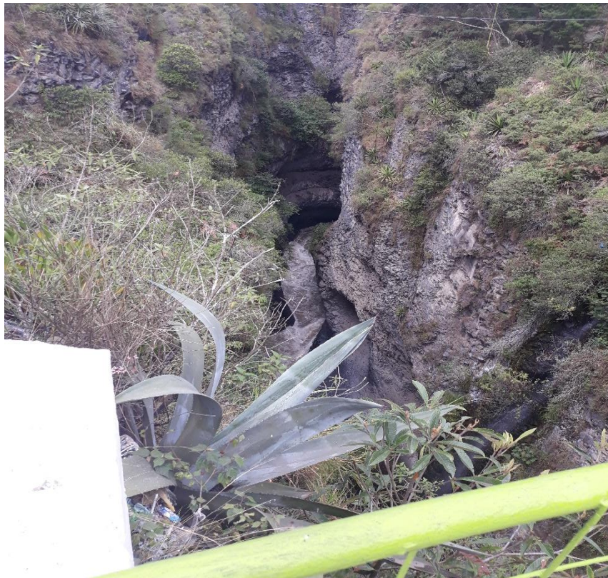
Foto 40 – Km 28+100 puente angosto metálico de 22 m sobre el río Pastaza (encañonado).