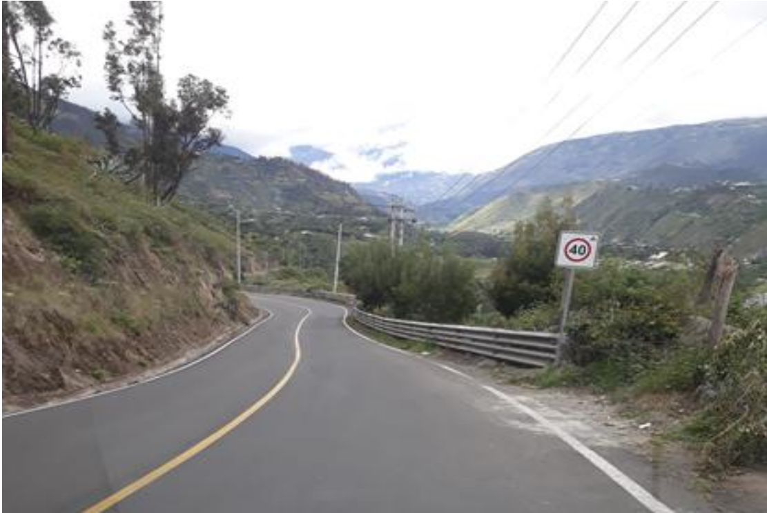
Foto 9 - Km 9+400 salida hacia Baños. Sección transversal de 6 m.