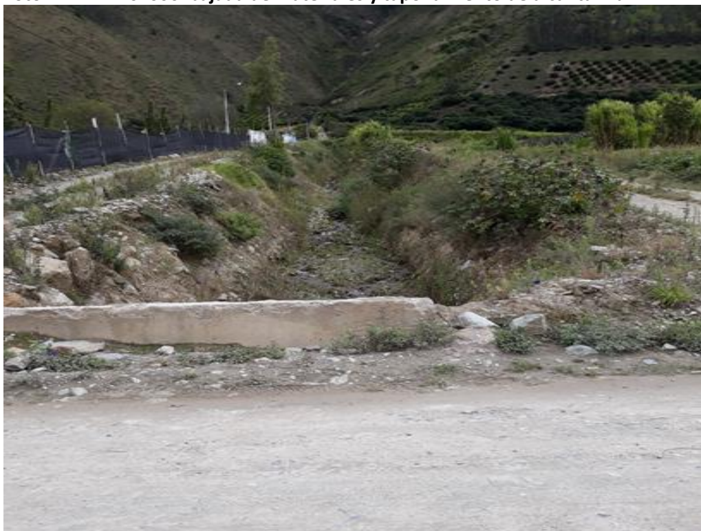
Foto 22 – Km 20+000 bajada de materiales y taponamiento de alcantarilla.