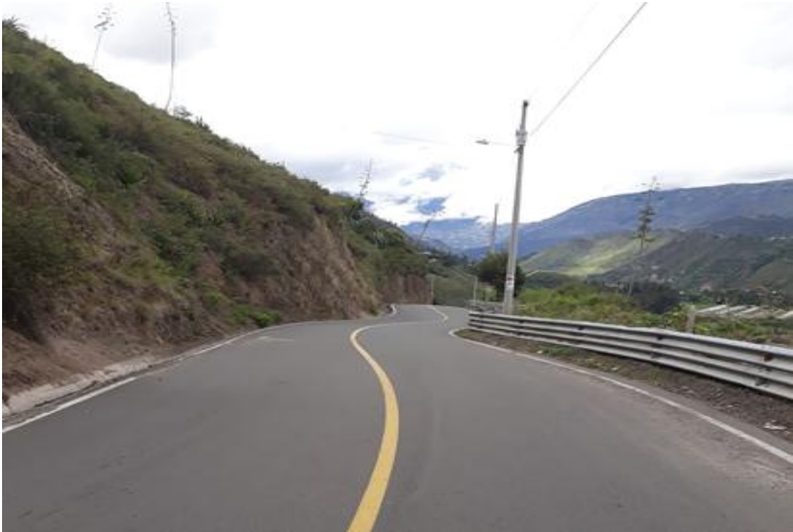
Foto 11 – Km 11+000 se mantiene sección transversal. Vista hacia Baños.