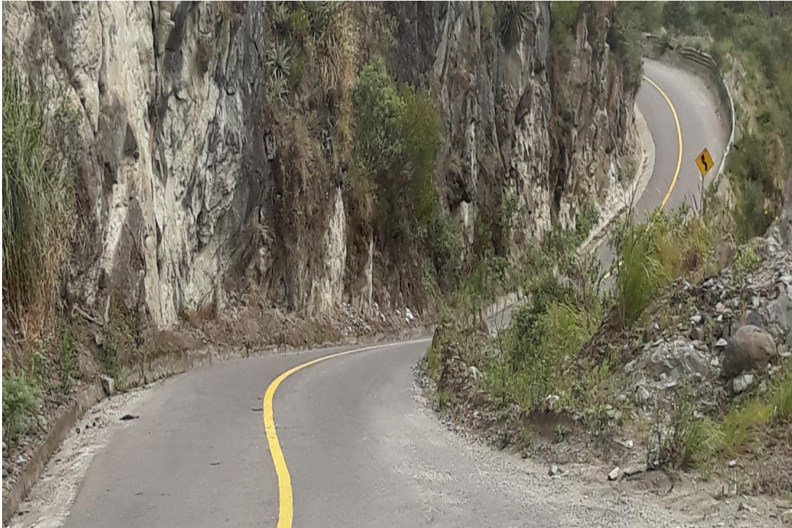
Foto 28 – Km 22+500 al km 24+600 zona crítica. Gradientes transversales fuertes.