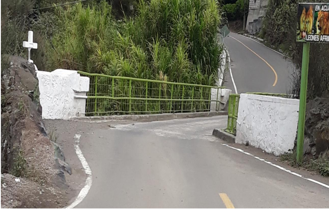
Foto 39 – Km 28+100 puente angosto metálico de 22 m sobre el río Pastaza (encañonado). Vista hacia Patate.