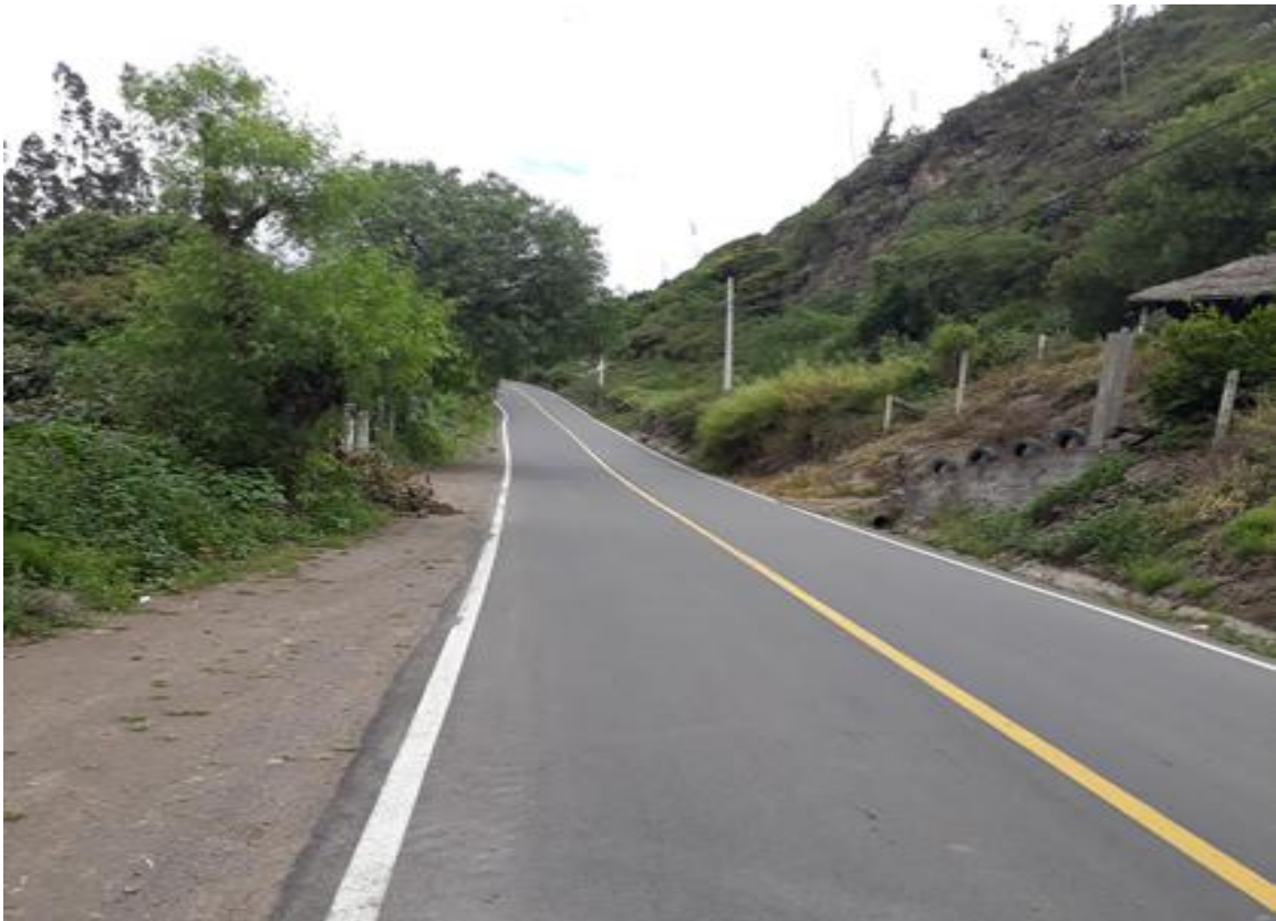
Foto 12 – Km 13+000 se mantiene sección transversal. Vista hacia Patate.