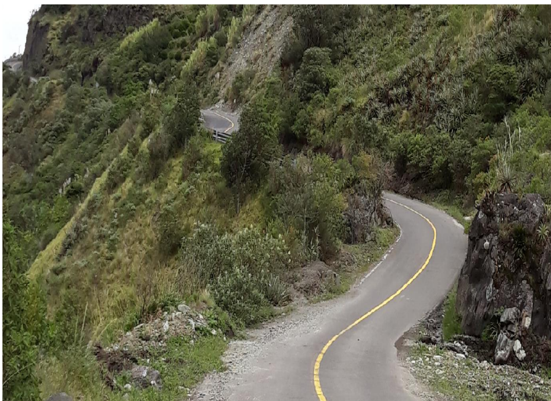
Foto 27 – Km 22+500 al km 24+600 gradientes fuertes. Vista hacia Patate.