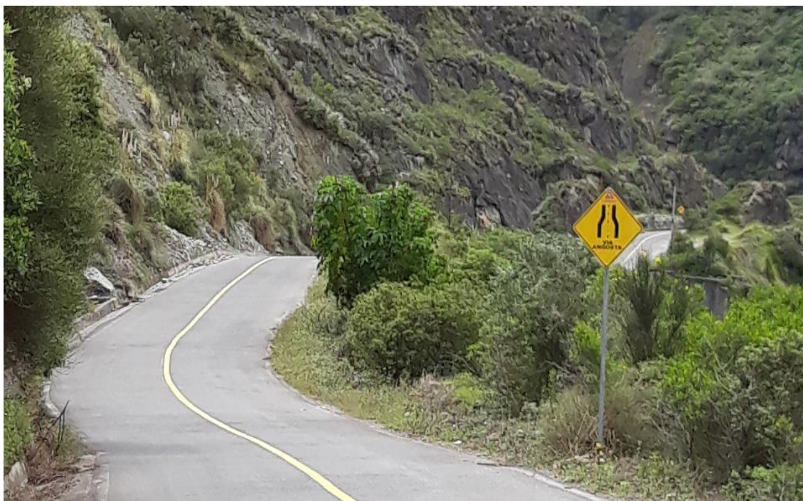
Foto 26 – Km 22+500 al km 24+600 gradientes fuertes. Vista hacia Baños.