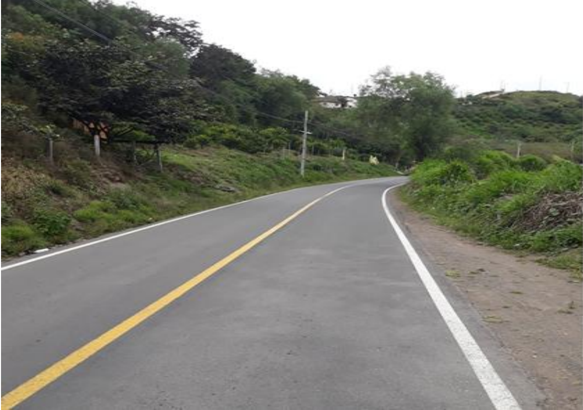
Foto 13 – Km 13+000 se mantiene sección transversal. Vista hacia Baños.