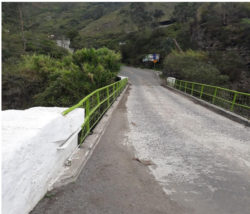
Foto 38 – Km 28+100 puente angosto metálico de 22 m sobre el río Pastaza (encañonado). Vista hacia Patate.