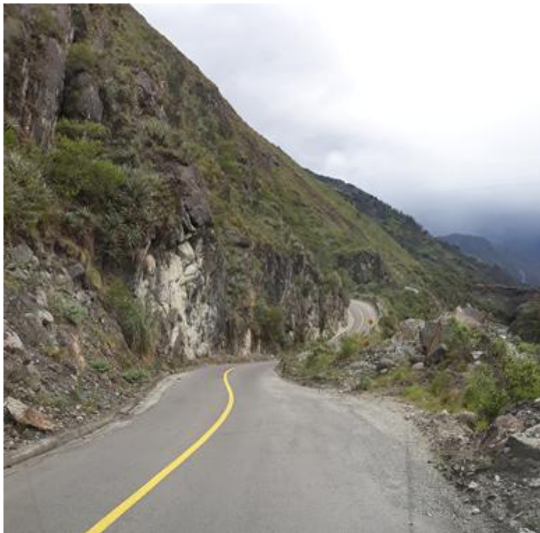
Foto 30 – Km 22+500 al km 24+600 zona crítica. Gradientes transversales fuertes.