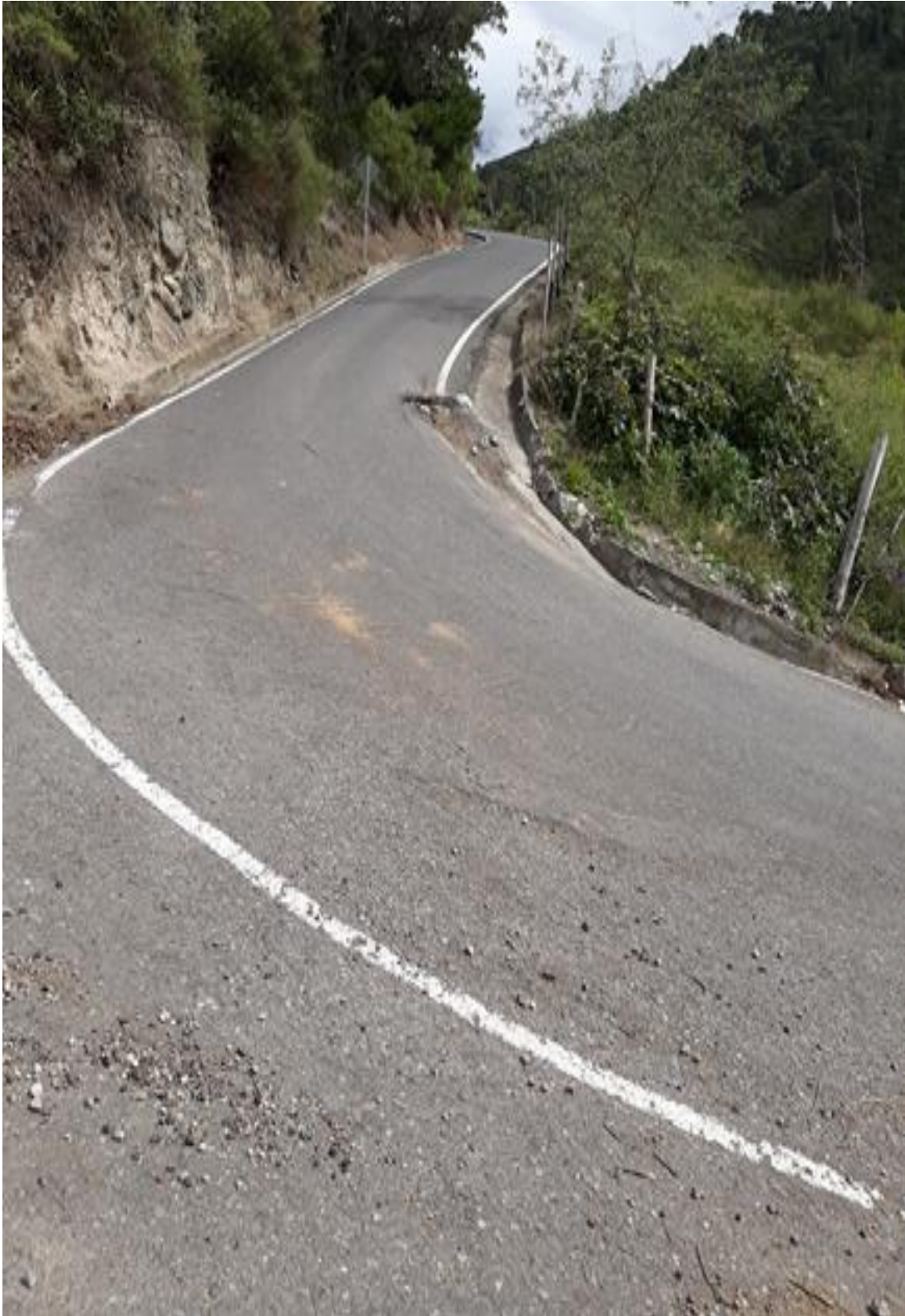
Foto 19 – Km 18+500 curva cerrada y gradiente fuerte. Vista hacia Patate.