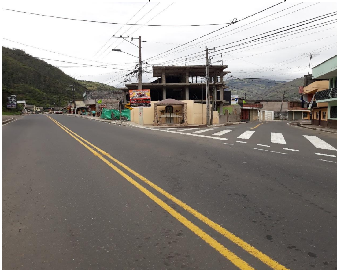
Foto 42 – Km 28+600 fin del tramo. Empate vía a Baños. Vista hacia Pelileo y Patate.