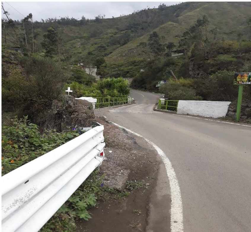
Foto 37 – Km 28+100 puente angosto metálico de 22 m sobre el río Pastaza (encañonado). Vista hacia Patate.