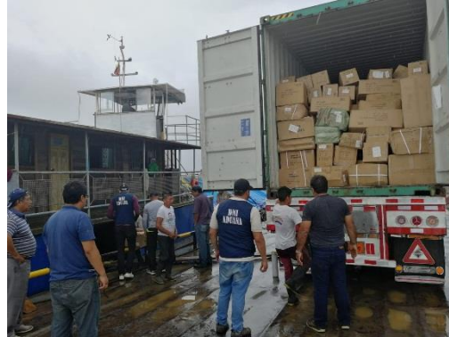
Personal de la Subsecretaría de Puertos, Armada y Aduana del Ecuador. Embarque de mercadería en la gabarra EL ZAFIRO.

Adicionalmente se realizaron inspecciones a las cooperativas de transporte fluvial público que operan en la Amazonia verificando que tengan toda la documentación en regla, desde el 11 al 16 de septiembre de 2019; los puntos de inspecciones fueron en: Tiputini y Nuevo Rocafuerte pertenecientes a la provincia de Orellana.