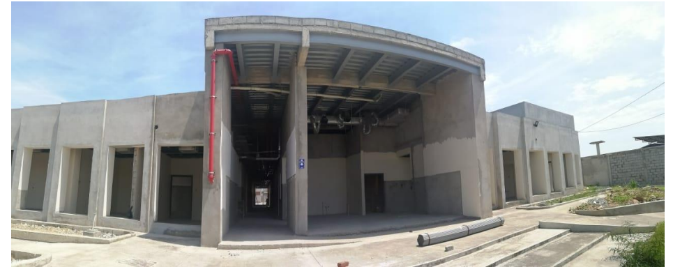
CENTRO DE SALUD BRISAS DEL MAR

Provincia: El Oro Inversión: USD 3,89 MM Área de construcción: 2.899 m 2 Beneficiarios: 35.500 habitantes Avance Físico: 83,75 % (Actualidad)