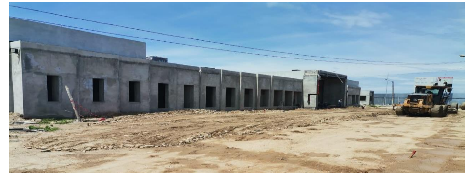
CENTRO DE SALUD EL PARAISO

Provincia: El Oro Inversión: USD 3,89 MM Área de Construcción: 2.554 m 2 Beneficiarios: 35.500 habitantes Avance Físico: 79,30% (Actualidad)